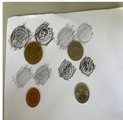
完成拓印，拿出硬幣比較看看